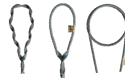
Sin Cablear Cableado Simple Cableado Para Poste